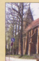
Den äldsta kyrkan i Mecklenburg, är med sin romerska del från 1200-talet och har en bronsdopfont från 1450