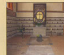
Kungskapellet 1423 stiftat av den svenska dr Agnes även hertiginna av Mecklenburg och gift med Albrecht II, visar hennes grav från 1