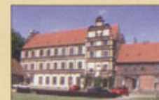
Renässanslott från 1571/73 Byggt på en slavvis med fasadutsmyck terrakotta från Lübeck gjord av holländare Statius van Dören