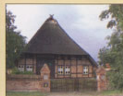
Rökeriet Möllin Herrgårdsliknande gård med museum, cafe, restaurang och scen