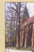
Den äldsta kyrkan i Mecklenburg, är med sin romerska del från 1200-talet och har en bronsdopfont från 1450