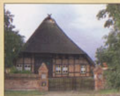
Rökeriet Möllin Herrgårdsliknande gård med museum, cafe, restaurang och scen